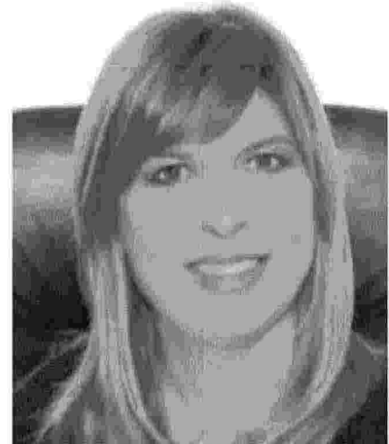
SOTTOSEGRETARIO Silvia Velo

« LA STAGIONE turistica – dicono gli organizzatori – è sicuramente il periodo di maggior spolvero per le isole, ecosistemi tanto suggestivi quanto delicati e fragili. Per questo il flusso turistico è allo stesso modo fonte di difficoltà per amministrazioni e servizi locali chiamati a far fronte ad una popolazione residente addirittura triplicata nei mesi estivi. Importante è un cambio di rotta e un'attenzione alla sensibilizzazione dei cittadini e dei turisti sul ruolo e sull'impatto che ciascuno ha sul territorio e sulle stesse ammini-