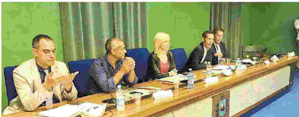
Il tavolo dei relatori al convegno sul riciclo dei rifiuti