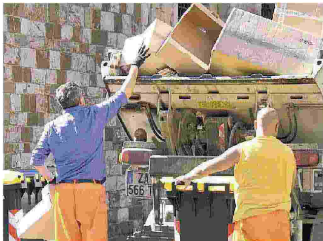
Raccolta di carta e cartone